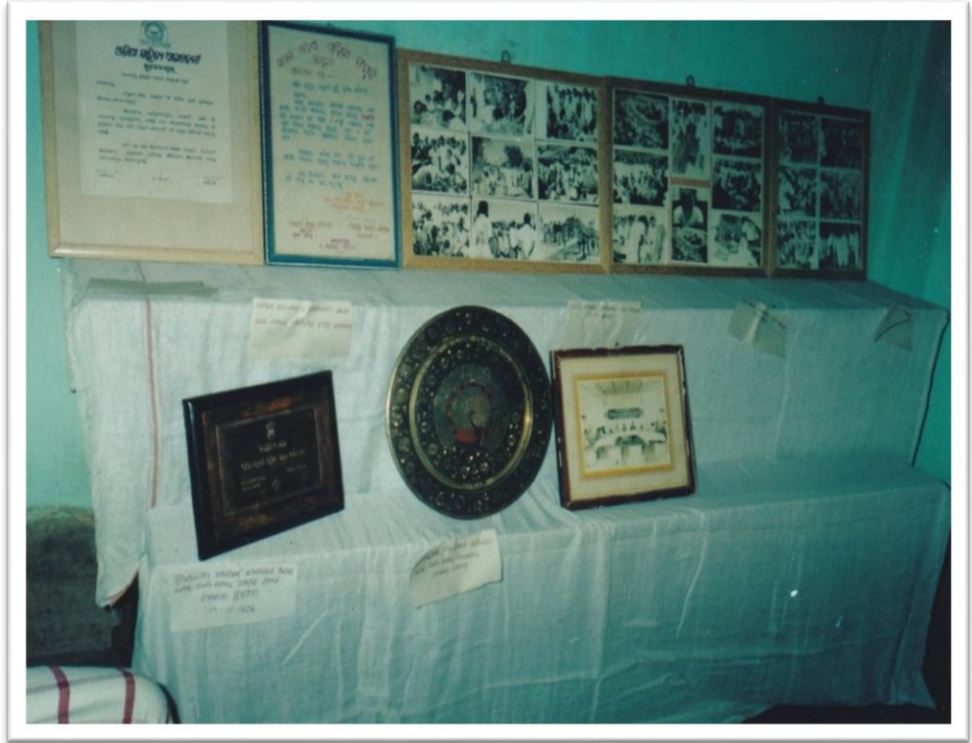
ඊනඋන ඉනඉන උනඋෑ නඋඋන උනඋ උනඋනඋ හව

හනවෑ හව ජනවයනව නවනඉෑ ඊනවෑෑ හනඋන ට (උනවන ඉන ජවබහ ජෙවබෑ ඊනඉන ඉඟඋනඋෑ ඊනඋනඋ ඊෑ) ට