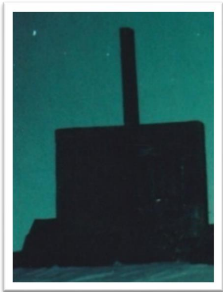
බඩුකැවීමේ ක්‍රියාවලියේදී භාවිතා කරනු ලබන මෙවලම.

බඩුකැවීමේ ක්‍රියාවලියේදී ඉහත සඳහන් කර ඇති පද්ධතියක් භාවිතා කර ගත හැක. මෙහිදී ඉහත සඳහන් කර ඇති පද්ධතියක් භාවිතා කර ගත හැක.