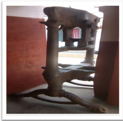
මුහුණතේ කැවීමේ ක්‍රියාවලියේදී භාවිතා කරනු ලබන මෙවලම.

ආකෘතියකට අනුව බඩුකැවීමේ ක්‍රියාවලියේ දී ඉහත සඳහන් කර ඇති පද්ධතියක් භාවිතා කර ගත හැක. මෙහිදී ඉහත සඳහන් කර ඇති පද්ධතියක් භාවිතා කර ගත හැක. මෙහිදී ඉහත සඳහන් කර ඇති පද්ධතියක් භාවිතා කර ගත හැක.