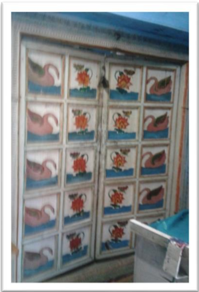
බඩුකැවීමේ ක්‍රියාවලියේදී භාවිතා කරනු ලබන මෙවලම.