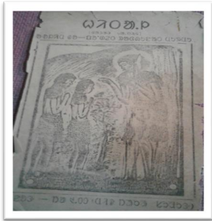
ධර්මයෙන් බැහැරවන අතර එහි මානවත්වය පවා අහිමිවීමට හේතු විය හැකි බව මනුෂ්‍යයන්ගේ මනසට තේරුම් ගත හැකි විය යුතුය.

ධර්මයෙන් බැහැරවන අතර එහි මානවත්වය පවා අහිමිවීමට හේතු විය හැකි බව මනුෂ්‍යයන්ගේ මනසට තේරුම් ගත හැකි විය යුතුය. මනුෂ්‍යයන්ගේ මනසට තේරුම් ගත හැකි විය යුතුය. මනුෂ්‍යයන්ගේ මනසට තේරුම් ගත හැකි විය යුතුය. මනුෂ්‍යයන්ගේ මනසට තේරුම් ගත හැකි විය යුතුය.