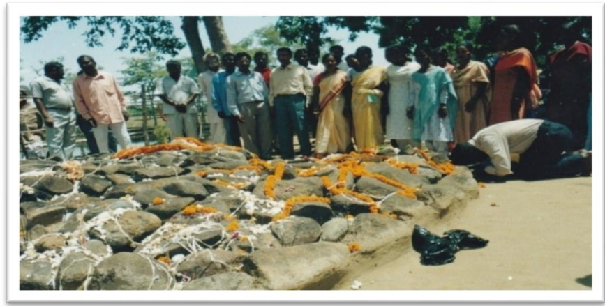
ප්‍රාදේශීය ආගමන-ප්‍රාදේශීය ආගමන ආගමන

ජනාදාන ආගමන. එනිසා නොහොඳ මට්ටමේ ජනාදාන ආගමන බහුතරයකින් සමන්විත වේ. මෙහිදී ආගමන කරුවන්ගේ ආධාරය ඇතිව ආගමන කටයුතු සලසා දීමට මහජන සේවකයන්ගේ සහයෝගය සහතික කළේය.