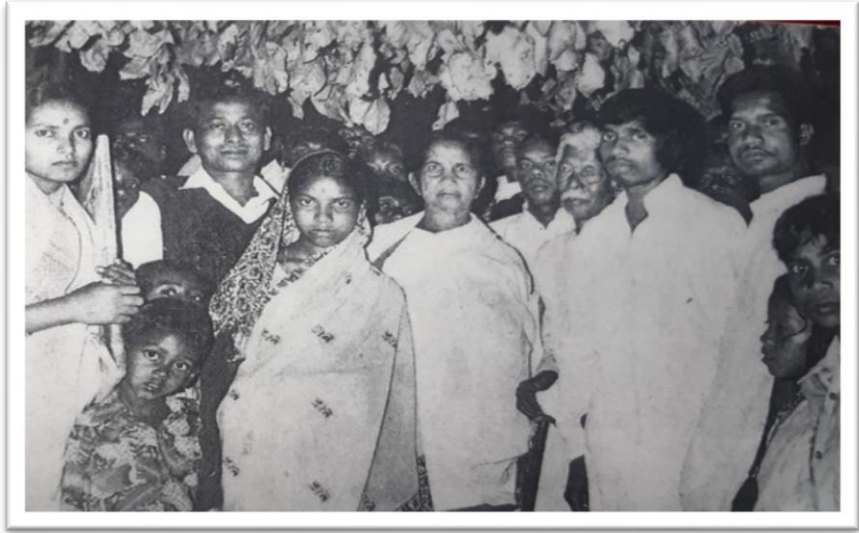
ශ්‍රී ලංකා ආරක්ෂක-ශ්‍රී ලංකා නැව් ජනාධිපති සමාජයේ ආරක්ෂක නිලධාරීන් සමඟ